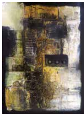
"chave para os meus segredos" Acrílico s/tela // 40x30 // 2014