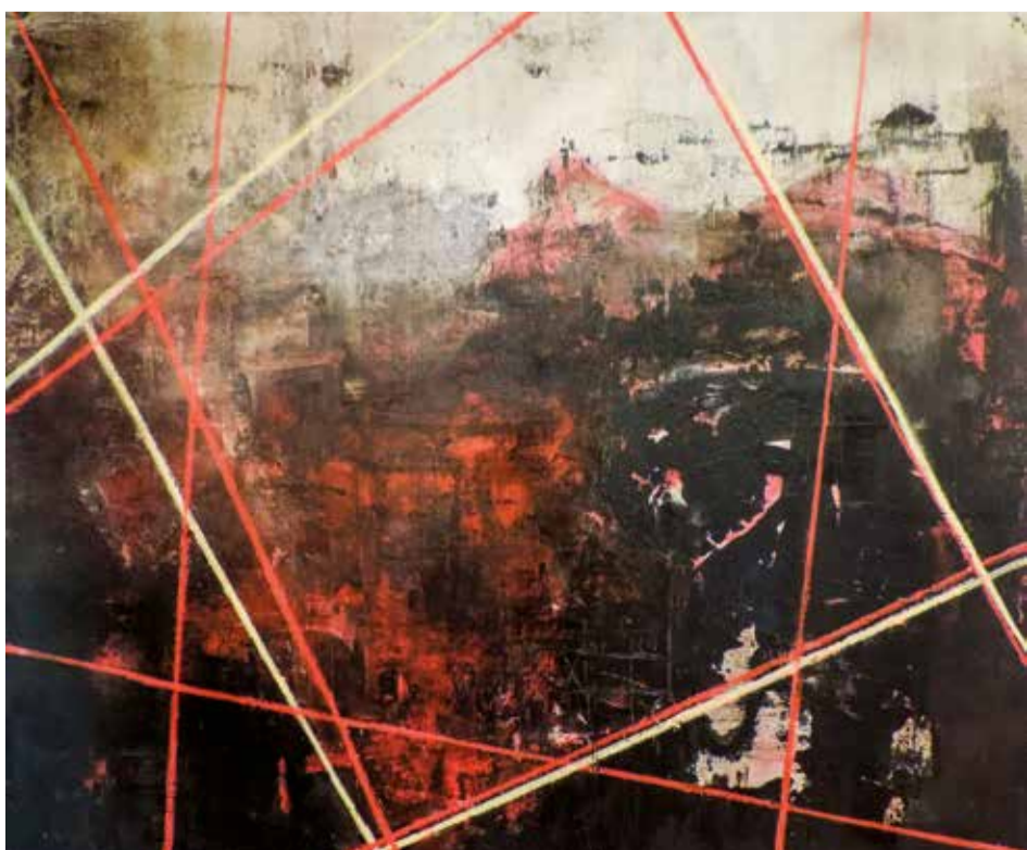
"ilusões" Acrílico s/tela // 100x120 // 2013