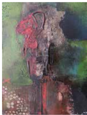
"diálogo no musgo" Acrílico s/tela // 30x24 // 2013