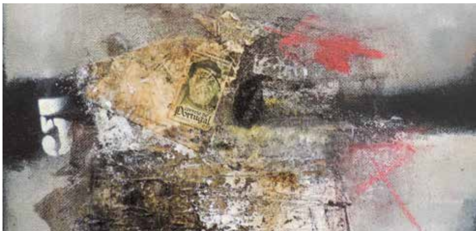
"código postal" Acrílico s/tela // 30x24 // 2013 (pormenor)