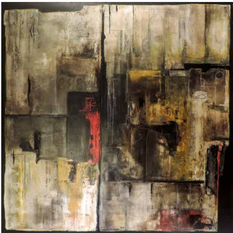
"universos lineares 1" Acrílico s/tela // 100x100 // 2014