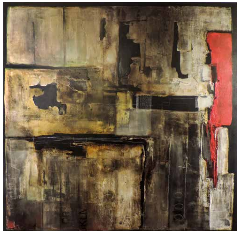
"universos lineares 2" Acrílico s/tela // 100x100 // 2014