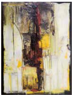
"portadas com memórias de gente" Acrílico s/tela // 40x30 // 2014