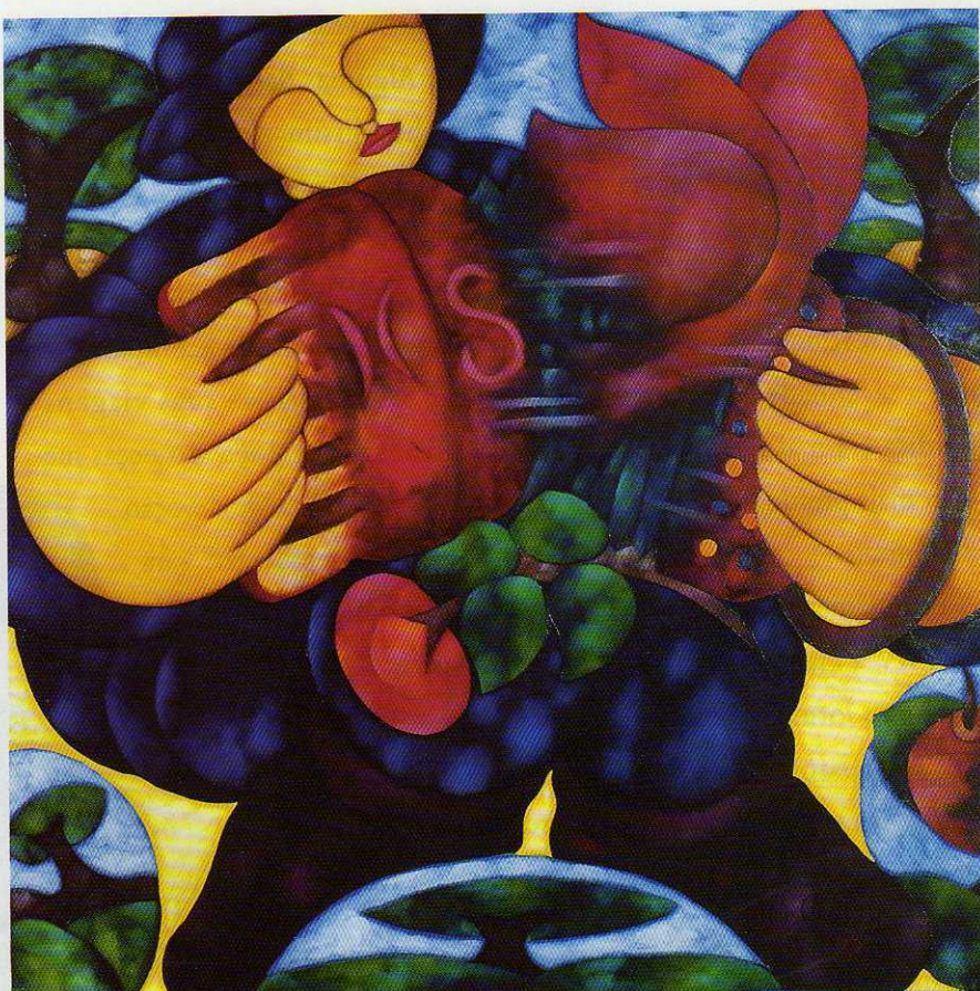
Um pouco de música - 100X100 cm

NA PÁGINA ANTERIOR: Mouvement et fantaisie - 100X100 cm