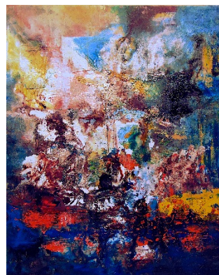
M-11 Bologna, técnica mista s/tela, 97x122cm, 2019